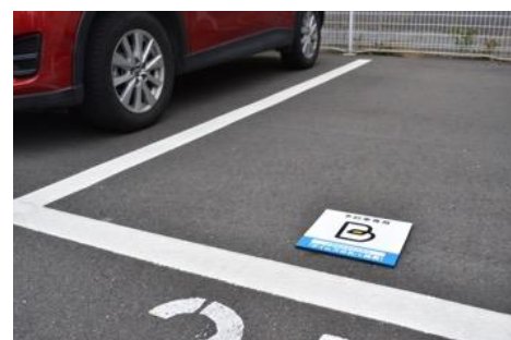
▲予約制駐車場「B」イメージ