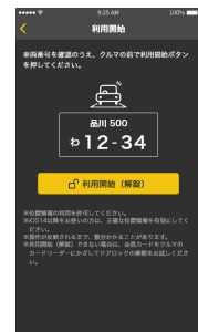
▲解錠時のアプリ画面

タイムズモビリティは今後も、会員様のご要望にお応えしたサービスの拡充と利便性向上を図るとともに、ストレスのない移動環境の実現に向けて取り組んでまいります。