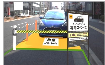
▲ステーションイメージ

道路上からすぐに出発できるようになることで、当該ステーションの近隣住民の方をはじめ、東北を代表する玄関口である仙台駅を訪れる方の移動手段の充実が図られ、仙台駅東エリアの移動がこれまで以上に快適になるものと考えております。