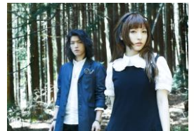
TRUSTRICK 神田沙也加 (Vo.) × Billy (Gt.)