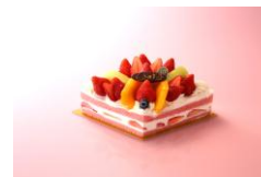
<新宿高野>ひなまつりデコレーション (約W22xD13cm) 3,996円