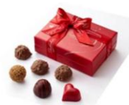
<ダスカリデス> 東急百貨店 ショ コラ&トリュフ (6個入) 1,080円