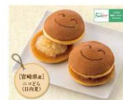
<蜂の家>ニコどら (日向夏) (1個) 216円