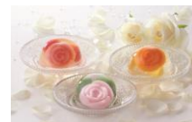
<鹿鳴館>ローズジュエル

<鹿鳴館>ローズジュエル(マンゴー・白桃・ブラッド オレンジ) 各1個 各<税込>324円