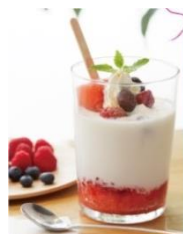
「 アイスキャンディフラップ 」 780円(税込)