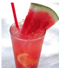
「 ウォーターメロンレモネード 」 750円(税込)

キレイに敏感な女性達も注目！ 野菜と果実の果汁だけを抽出し た栄養たっぷりのジュース。