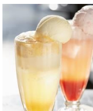
「 クリームソーダファウンテン (5種) 」各681円(税込)