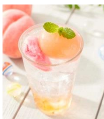
「 ピーチ・ピーチソーダ 」 648円(税込)

香ばしいほうじ茶とミルクのやさし い甘さがピッタリ。旬の和テイスト をお楽しみください！