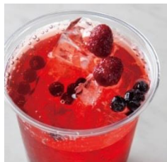
「 ベリーソーダ 」 M 550円、L 650円(税込)

フルーツピューレ入りのソーダに アイスをトッピング！ 気分も上がるアメリカンドリンク。