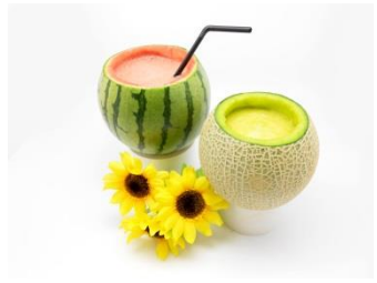
まるごと玉シリーズ すいか玉 999円(税込) メロン玉 999円(税込) ※注文を受けてから調理