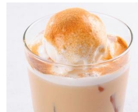
「 ほうじ茶フロート 」 648円(税込)