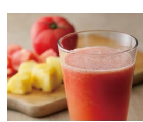
「 コールドプレスジュース 」 490円(税込)～

飲むだけでキレイになれそうな ビタミンたっぷりスムージー。 生グレフルの器もステキ！