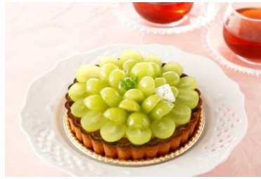
シャインマスカットタルト 直径15cm 3,780円(税込)

青果専門店として全国展開している <九州屋>が運営する、四季折々の旬の 果物を詰合せたご進物やカットフルーツを はじめ、新たにフレッシュフルーツタルトや ジュースをご提案するフルーツショップです。