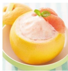
「 ピンクグレープフルーツ スムージー 」850円(税込)