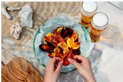
BBQ ケイジャンシーフード