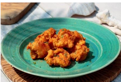
Mallorca特製フライドチキン