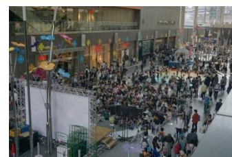
※画像は2017年の様子です