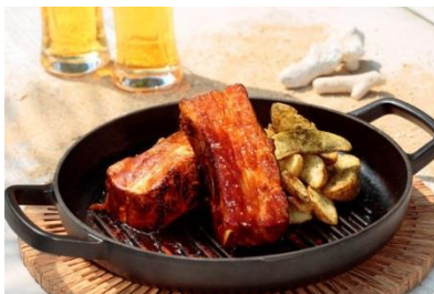
国産もち豚のスペアリブ