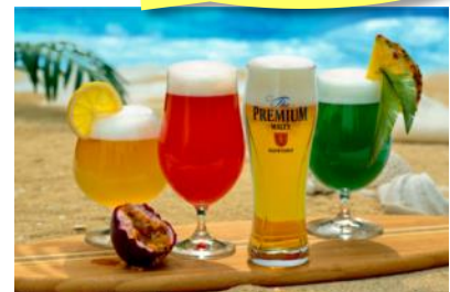
二子玉川ライズ限定 ビアカクテル各種 (左)レモネードビア (中左)パッションフルーツビア (右)パイナップル&ビネガービア