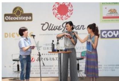
※画像は2017年の様子です