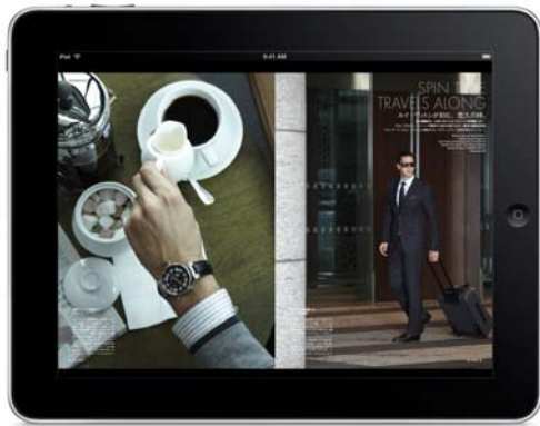
GQ JAPAN 11月号 動画付きプロモーションページ