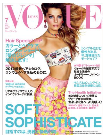
VOGUE JAPAN 2012年7月号