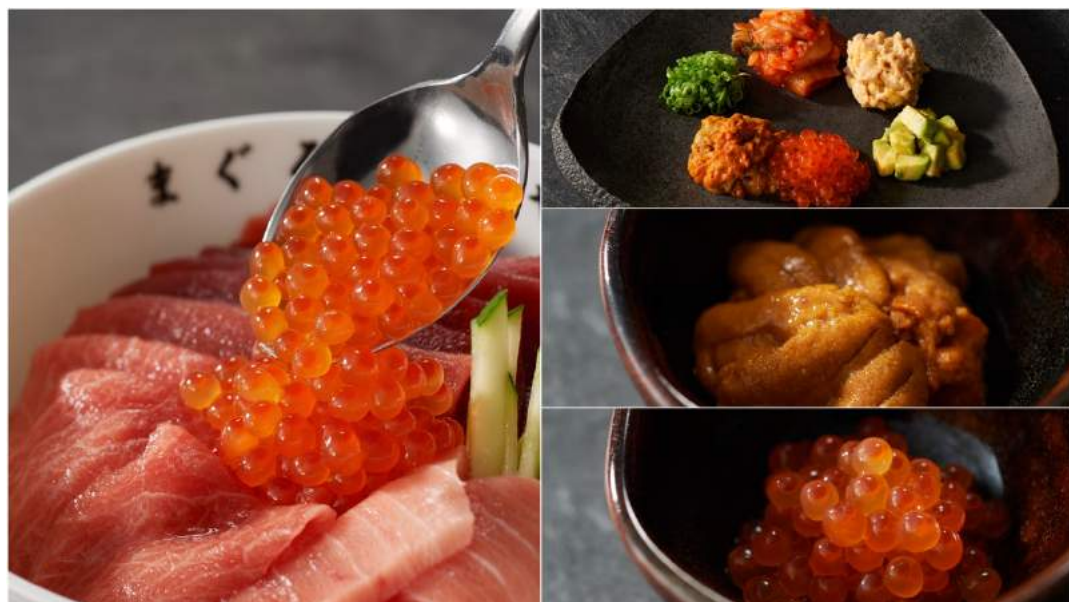
自由にアレンジできる“まぐろとしゃり”のまぐろ丼