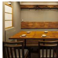
1組様限定の完全プライベート個室 テーブル席 4~6名様