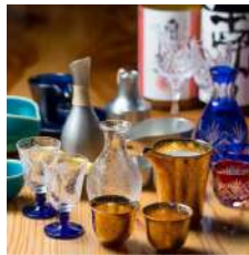
厳選日本酒を心弾む酒器にてご提供 全国津々浦々から、お料理に合う季節の日本酒を厳選して入荷。

当店のコース料理は基本が「おまかせ」。旬の食材との出逢いを大切にさせていただきたいから、その時仕入れる新鮮な紀州食材を調理しご提供。取り分ける必要のない当店の串料理は、宴会はもちろんのこと接待にもぴったり。ぜひご利用ください。