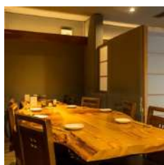
テーブル席は8名様まで 最大18名様まで