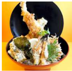
ボリューム満点!太刀魚を丸ター本贅沢に揚げた天井や、しらす丼なども人気