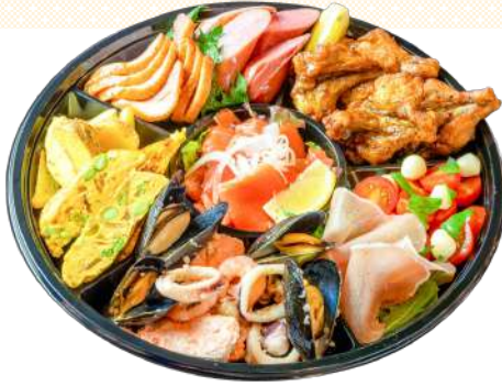
イタリアンオードブル