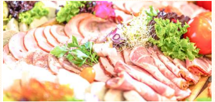
イタリアンオードブル