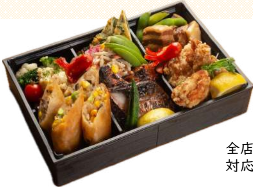
全店舗 対応できます