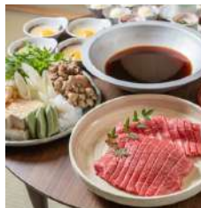
自家製割下が決め手!熊野牛すき焼き宴会コース ¥5,500(飲み放題付き)