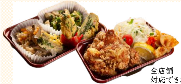
全店舗 対応できます