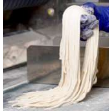
自家製麺 24時間熟成が決め手の自家製うどん

毎日打ち立て、切り立て、茹でたてのおうどんが自慢の同店ではうどんはもちろん天ぷらもサクサク!! そんなサクサクの天ぷらの乗った天井は周辺サラリーマンに超人気!夜は2階のお座敷を貸切にして完全プライベート空間での宴会はグループ店の中でも超リーズナブル!!