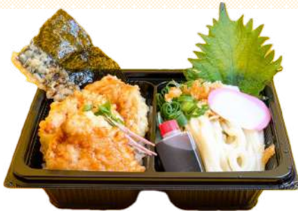
ミニサイズの うどんと 天丼のセット