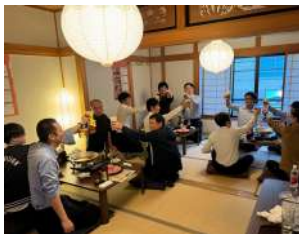
2階貸切/1日1組様限定! お座敷席は最大20名まで