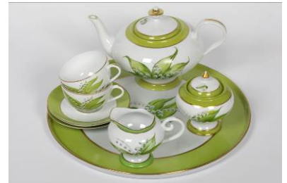
ロール セリニャック