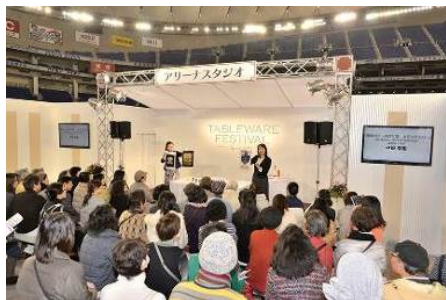
アリーナスタジオ

アリーナ中央のライブステージで行う、毎年ご好評をいただいているテーブルセッティングライブやデモンストレーションに加え、参加型のサロンセミナーを今回も開催いたします。期間中毎日開催する、各分野の第一線でご活躍の先生方によるステージイベントや参加型のセミナーで、「テーブルウェア・フェスティバル」をより一層お楽しみいただけます。