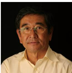
石坂 浩二 (俳優)