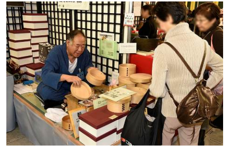
展示販売コーナーイメージ