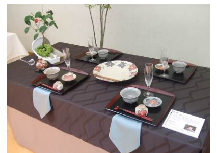
セッティングイメージ