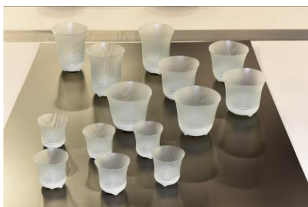
第23回オリジナルデザイン部門 大賞・経済産業大臣賞「しまのうつわ」

また、前回のオリジナルデザイン部門、コーディネート部門の大賞受賞者による、“創り手”と“使い手”のコラボレーション展示も人気が高く、今回も展示する予定です。