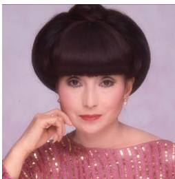
黒柳 徹子 (女優、ユニセフ親善大使)