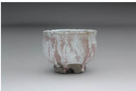
岡田裕 作 白釉窯変茶壺

国内特集は、おだやかな色合いを特徴とし、古くから多くの茶人に愛されてきた萩焼です。コーナー入口には伝統の萩焼を、中程からは先人たちのエネルギーを受け継ぎながらも、作家独自の新しい風を吹き込んだモダンな萩焼を、セッティングとともに紹介いたします。今すぐ食卓に取り入れたくなる萩焼の「今」をお届けします。