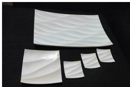
坂倉善右衛門 作 彩色掛分皿