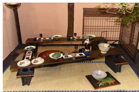
第23回コーディネート部門 大賞・経済産業大臣賞「お☆バンザイ!!」