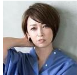
辺見 えみり (タレント) ※初参加