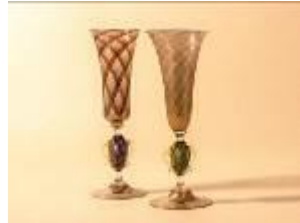
ヴェネツィアガラス