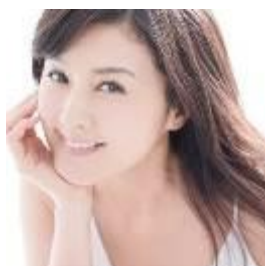
藤原 紀香 (女優・NPO【Smile Please☆世界子ども基金主催】) ※初参加