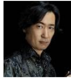
東儀 秀樹 (雅楽師・作曲家)