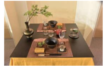
特別審査部門 麺を愉しむ“食卓”コンテスト 最優秀奨励賞