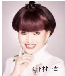
黒柳 徹子 (女優・ユニセフ親善大使)