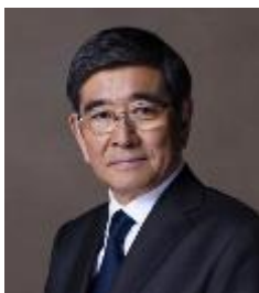
石坂 浩二 (俳優)