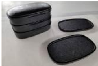
オリジナルデザイン部門 大賞・経済産業大臣賞