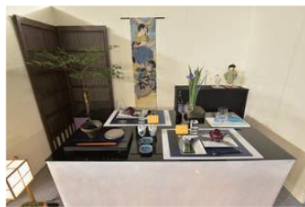
コーディネート部門 大賞・経済産業大臣賞