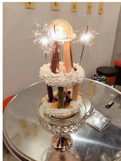
「ソウルタワー」 2,530円 (税込) 韓国のシンボル”ソウルタワー”をイメージした、全高60cmのオリジナルスイーツです。盛り上がることに間違いなしの一品です。