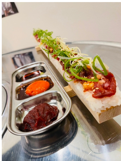
「ロングユッケ寿司」 フルサイズ (55cm) 2,508円 (税込) ハーフサイズ (33cm) 1,628円 (税込) 韓国で人気のユッケ寿司を、こだわりの桜ユッケを使って再現。目で見ても楽しめる一品です。

韓国 釜山から一年中新鮮な活タコをお取り寄せ。現地の味わいをそのまま京都でお楽しみいただける一品です。