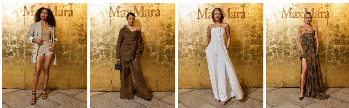
左からヤラ・シャヒディ、ローラ、バリキーズ、キャロライン・ダウアー

6月11日（現地時間）開催のマックスマラー 2025年リゾートコレクションに、ローラやケイト・ハドソン、ニッキー・ヒルトン、ペ・ドゥナ、ヤラ・シャヒディなど豪華なゲストが集結しました。