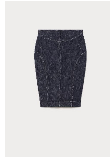
デニムスカート ¥47,300 税込