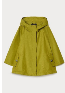
ビジュア付きアウター ¥124,300 税込