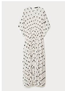
ブリーツロングドレス ¥195,800 税込