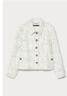
ツイード ジャケット ¥177,100 税込