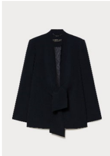
ブレザー ¥156,200 税込