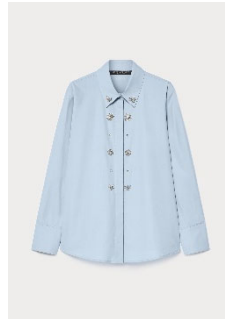
ビジュア付きシャツ ¥93,500 税込