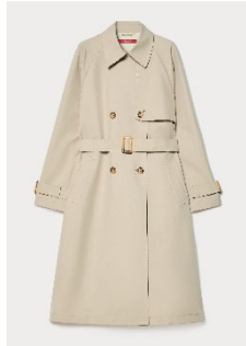
トレンチコート ¥123,200 税込