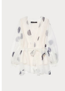
オーガンジーブラウス ¥173,800 税込