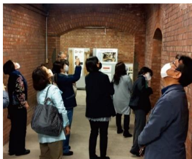
過去開催時の様子