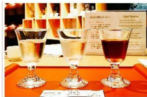
全国各地の様々なお酒を 1 杯 100 円から 常時 100 種類以上から試飲が可能です。 □ケ・取材撮影・場所貸しも受け付けております (応相談)