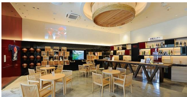
「日本の酒情報館」 住所：東京都港区西新橋 1-6-15 ※当会ビルの 1 階にございます。

当会が運営する「日本の酒情報館」は、歴史と文化を含む日本酒・本格焼酎・泡盛の魅力のすべてを「見て・触れて・体験する」ことを通じて理解を深めていただく施設です。