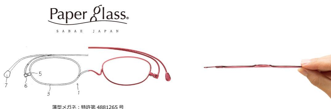
薄型メガネ：特許第 4881265 号

株式会社西村プレジジョン(福井県鯖江市丸山町 3 丁目 4-19) 代表取締役社長 西村昭宏が発明者である「薄型メガネ：特許第 4881265 号」が、平成 26 年度近畿地方発明表彰「近畿経済産業局長賞」を受賞いたしました。