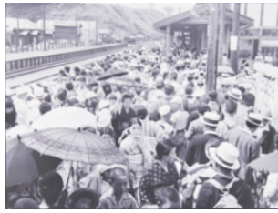
海水浴客でにぎわう銭函駅のホーム 1937(昭和12)年