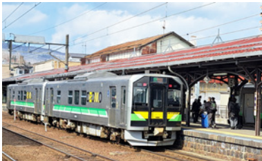
JR北海道の電気式気動車H100形(小樽駅)