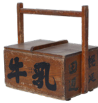
駅立売容器(幌延駅前)の田辺商店 昭和期 幌延町郷土資料館蔵