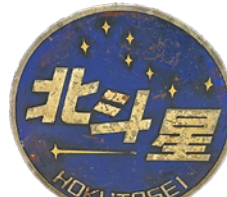
寝台特急北斗星のヘッドマーク 北海道鉄道技術館蔵