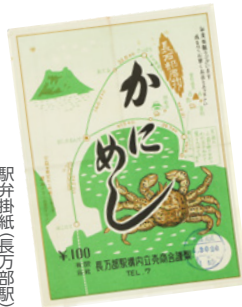
駅弁掛紙(長万部駅) 1960年代頃