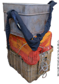
行商人が使ったガンガン(再現) 小樽中央市場協同組合蔵