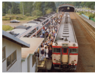
紅葉狩り臨時列車(JR石勝線滝ノ上駅) 1994(平成6)年 小樽市総合博物館蔵星コレクション