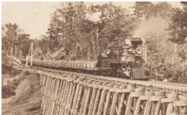
機関車弁慶号 1883(明治16)年頃 北海道大学附図書館蔵