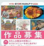
くぼらだんだんアート 2025 (作品公募展)