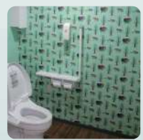
アートトイレ (ローソン札幌北20条東店)