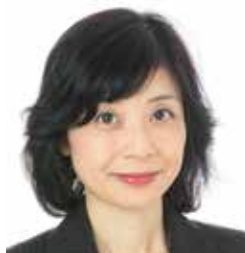
社会保険労務士法人グラス代表 特定社会保険労務士