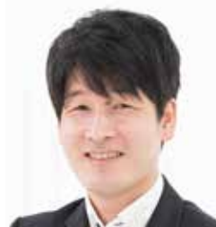
NPO法人ファザーリング・ジャパン副代表理事 パパライフサポート代表

大学卒業後、化粧品会社および専門商社を経て平成10年、社会保険労務士試験に合格。平成18年から4年間、厚生労働省東京労働局にて次世代法(くるみん)を担当。平成22年、社労士法人グラスを開業し現在に至る。(株)グラスでは研修およびコンサルティングを実施。