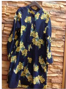
MACPHEE ワンピース ¥3,980