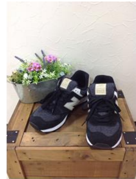
NEW BALANCE スニーカー ¥3,980