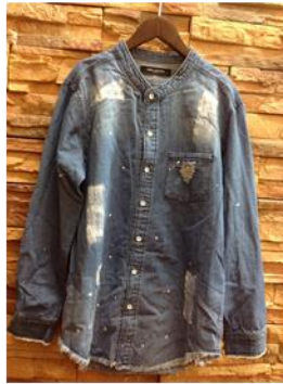
NANO UNIVERSE シャツ ¥2,980