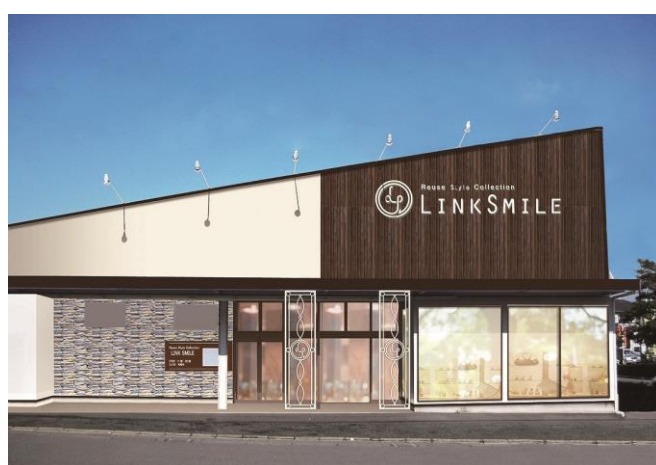
LINK SMILE 鎌倉台店 外観

日本最大級のリユースデパートを展開する株式会社コメ兵(以下「KOMEHYO」)は、2018年2月9日(金)に毎週金曜日に店内の商品が一斉値下げする新業態の店舗「LINK SMILE 鎌倉台店」をリニューアル OPEN いたします。店舗には買取ブースを新設し、宝石・貴金属、時計の買取も可能となります。