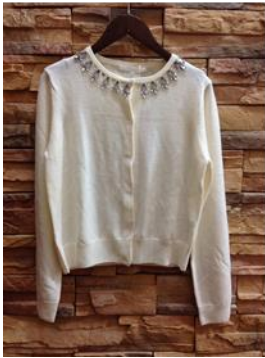
ANAYI カーディガン ¥3,980