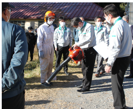
学生に機械の操作を教えている様子