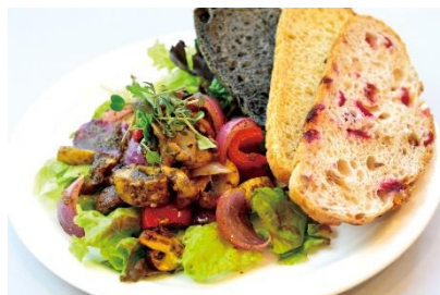
グリルベジタブルサラダ ¥1380