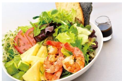
ジャンボシュリンプサラダ ¥1580

株式会社アイランドヴィンテージコーヒージャパン(本社:神奈川県横浜市)は、 日本上陸第一店の青山店において、 5種類のサラダメニューとトマトバジルスープのご提供をスタート。 また、来年2月には表参道に日本2号店のオープンが決定いたしました。