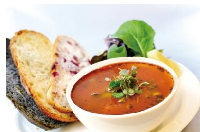
トマト&バジルスープ ¥740