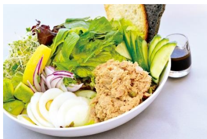
パシフィックアヒサラダ ¥1380