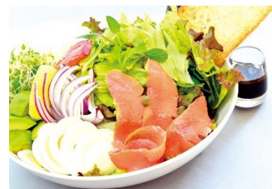
ロックプレートサラダ ¥1520