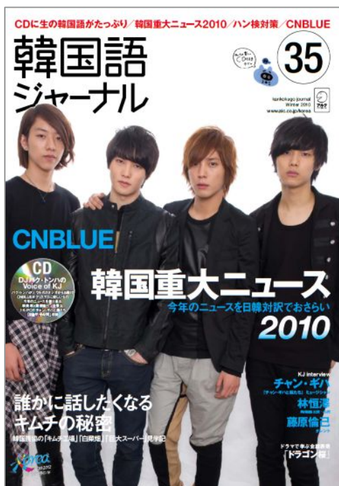
<『韓国語ジャーナル』35号表紙>

2002 年に創刊した日本で唯一の韓国語学習ムックです。目から耳から、韓国を知るための硬軟織り交ぜたコンテンツが特徴。人気ドラマで学ぶ会話表現、学習ページや今の韓国が分かる情報コーナーなどの連載、そして付録の CD「Voice of KJ」では、韓国のラジオ番組のような構成で著名人らのインタビューが楽しめます。