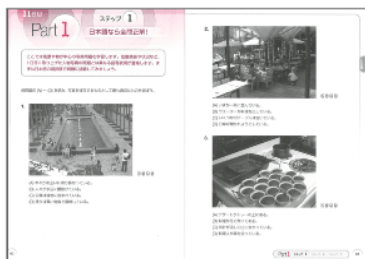
<日本語の選択肢からスタート>