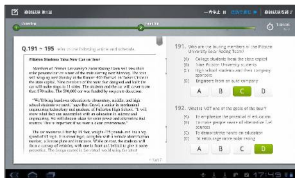
<Part 7 画面例>