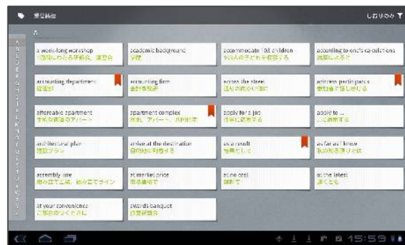
<「語彙」コーナー画面>