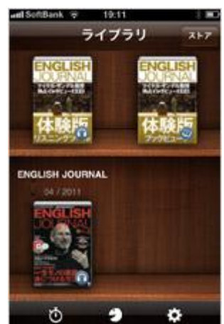
購入したコンテンツは「ライブラリ」で確認できます

『ENGLISH JOURNAL』2010 年 7 月号掲載で話題を呼んだ、 NHK「ハーバード白熱教室」で知られるマイケル・サンデル教授 へのインタビュー(音声付)が収録されています。 「ブックビューア」「リスニングツール」など「ENGLISH JOURNAL for iPhone」のさまざまな機能が体験できます。