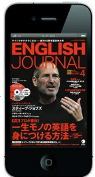
ENGLISH JOURNAL for iPhone 4月号