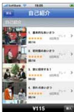
コンテンツ購入画面