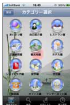
カテゴリー選択画面

1つの動画で多言語字幕を切り替えられる為、制作費のコストダウン、動画の2次利用の市場範囲を広げる事にもなり、購入しやすい販売価格を実現しました。