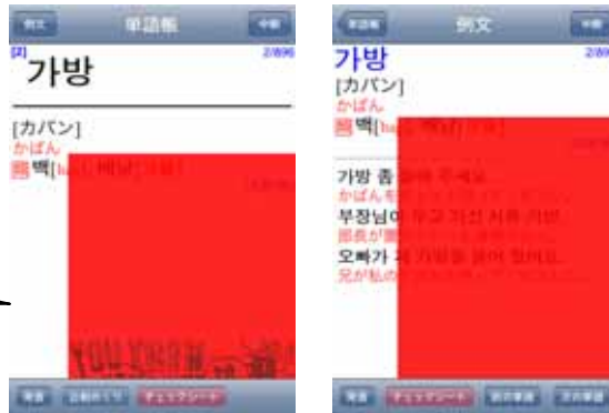
<赤いチェックシート画面>