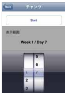
<チャンツの設定画面>

は、「キク 英単語【初級】」「キク 英単語【中級】」「キク 英単語【上級】」バージョンアップ版に追加した機能です。