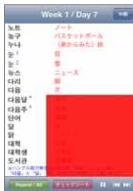
<日単位の単語一覧>