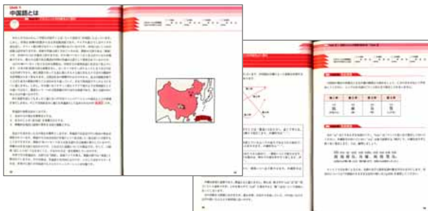
たくさんの図表を掲載した分かりやすい構成です。

[本体]1,800円(税込1,890円) [ISBN]978-4-7574-1589-8 [サイズ]A5判 [頁数]232ページ [CD]1枚(54分) 収録言語:中国語(普通話) [対象レベル]中国語入門