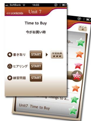
「ヒアリングマラソン」の人気コーナーをアプリ化！ 集中的にディクテーションを行い弱点を克服。

ディクテーションとは、「英語を聞き取って、英文を見ずに書き取ること」です。シンプルな学習法ですが効果は大きく、続けることで聞き取り力が飛躍的にアップし、確実に定着することが知られています。本アプリでは、英語長文を題材に、 日本人の間違い率が高い単語／フレーズを集中的にディクテーション 。原因を探りつつ役立つアドバイス・解説を提供します。