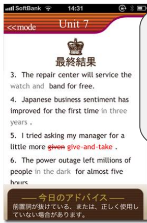
間違いやすい項目に沿った練習問題。 【EasyWriting】システムを使用した自動添削。