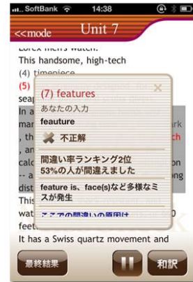
書き取りモードでは、間違い率の高い項目についての詳細な解説を表示。