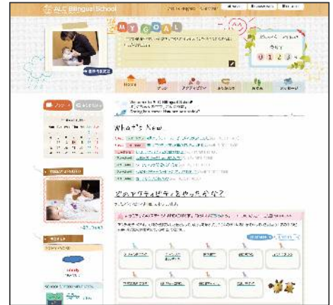
<受講生専用ウェブサイトトップページ>

(※1) 0 か月から3 年間続けた場合。(※2) 湘南国際ナショナルスクール: 神奈川県藤沢市にある国際ナショナルスクール。独自のカリキュラムで数多くのバイリンガルを育成。