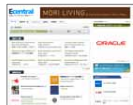
< 「Ecentral」ページ >