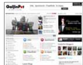
< 「GaijinPot」ページ >

「GaijinPot」登録者とアルクで英語を学んでいる人とが文化の相互発信を行えるコミュニティサイトの立ち上げに取り組んでいきます。