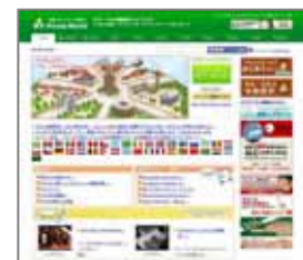
< 「Alcom World」ページ >