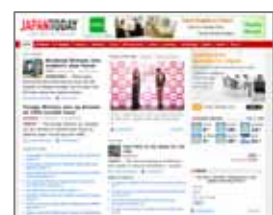
< 「Japan Today」ページ >