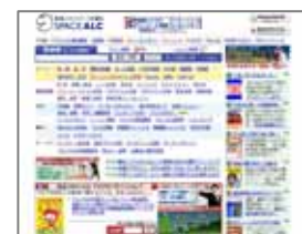
< 「SPACE ALC」ページ >