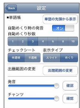
自動めくり機能を使って、単語を連続的に学習することも可能