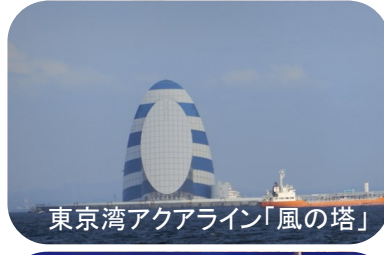
東京湾アクアライン「風の塔」