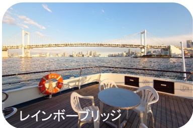
レインボーブリッジ