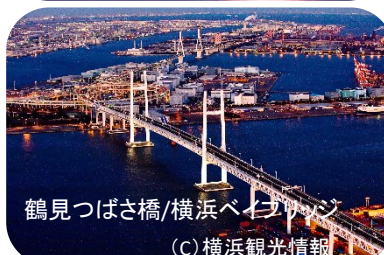
鶴見つばさ橋/横浜ベイブリッジ