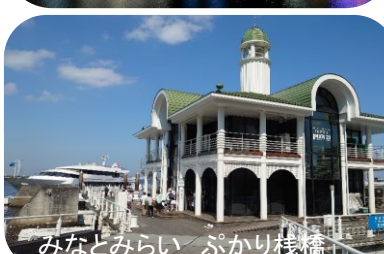
みなとみらい ぶかり桟橋