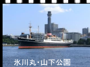
氷川丸・山下公園