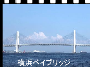
横浜ベイブリッジ