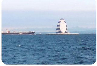
東京湾アクアライン 「風の塔」