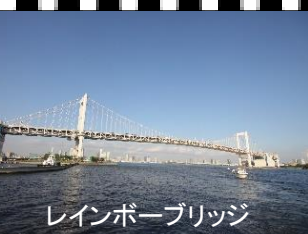
レインボーブリッジ