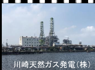
川崎天然ガス発電(株)