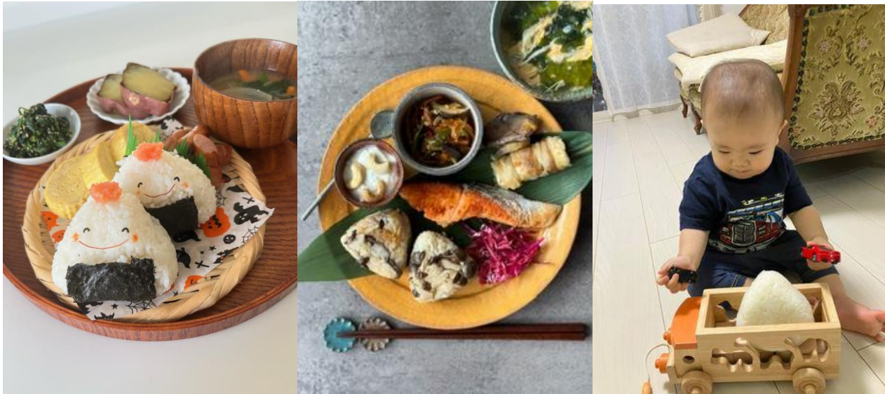
おにぎりアクション2023の参加者から寄せられた写真

日本発、世界の食料問題の解決に取り組む特定非営利活動法人 TABLE FOR TWO International（以下、TFT）は、国連が定めた10月16日「世界食料デー」（世界中の人が食べ物や食料問題について考える日）を記念し、おにぎりの写真投稿でアフリカ、アジアの子どもたちに学校給食をプレゼントできる「おにぎりアクション2023」を実施中です。期間は10月4日（水）～11月17日（金）。開始初日にはXでトレンド入りし、12日間で7万枚以上の写真が日本・世界各地から投稿されるなど盛り上がりを見せています。 https://onigiri-action.com/