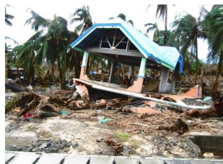
超大型台風ハイヤンの被災地であるヴィサヤ地域

超大型台風ハイヤンの被災地であるフィリピンのヴィサヤ地域レイテ島にて、農業技術の支援プログラムを実施しています。2013年11月にフィリピンを襲った超大型台風ハイヤンの被災地であるヴィサヤ地域では、他地域と比べても小規模の農家が多く生活しており、被災以前から貧困が蔓延していました。台風被災を受けて、農地は壊滅状態となり、農家は生計を支える農業ができなくなりました。この度のカロリーオフセットでは、地元農家に対して、種子や苗、