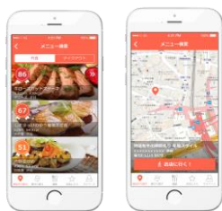
外食・テイクアウトで 健康的なメニューを注文 （カロリーオフ）

今回、渋谷周辺を対象にしたのは、渋谷には IT 企業をはじめ多くの企業が事務所を構えているため、「Mealthy」と「OFFICE DE YASAI」は、多忙なビジネスパーソンが、外食からテイクアウト、事務所内まで様々なシーンで、健康的な食事を簡単にとれるよう提案し、健康管理をサポートします。