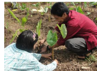
開発途上国の農業支援 （カロリーを生み出す）