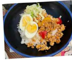
和風ガバオライス

2008年に大学として日本ではじめてTFTに参加して以来、継続してTFTメニューを学生食堂で提供しています。2023年は105食を販売し、健康に配慮しながらアジア・アフリカの子どもたちに給食を届けています。