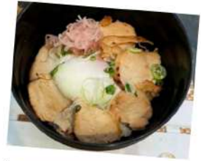
鶏むね肉のチャーシュー丼