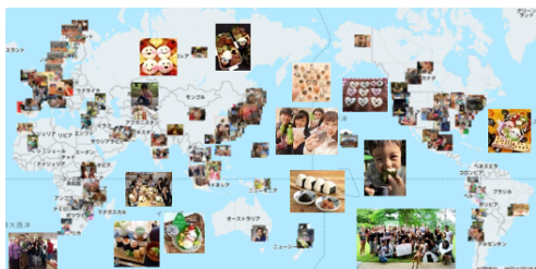
投稿が 10 万枚を超えた際のグローバルマップ