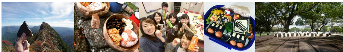
昨年投稿された写真