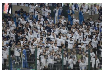
球場でファンが応援 (カロリー消費)