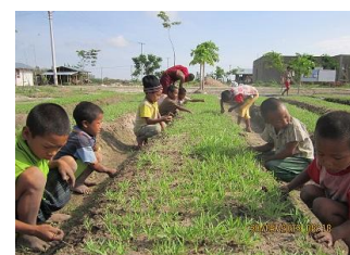
開発途上国の農業支援に (カロリーを生み出す)