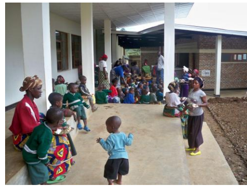
▲当社の寄付で建設された「給食室」

今後も対象商品販売を通じて、支援先には栄養改善と教育機会を、お客さまにはヘルシーな食生活をお届けしたいと考えています。