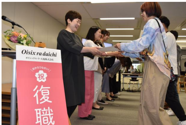
▲（左から）公開した復職証書テンプレート、復職証書の授与の様子（2025年）