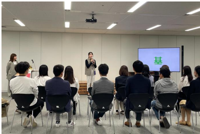
▲2025年に実施した「復職式」の様子