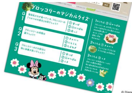
▲（左から）ランチョンマットとピック、コップの蓋とチャーム、ブロッコリーにまつわるクイズ