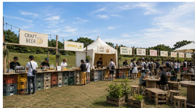
▲畑の恵みを味わう、総延長30m超のドリンクバー（イメージ）