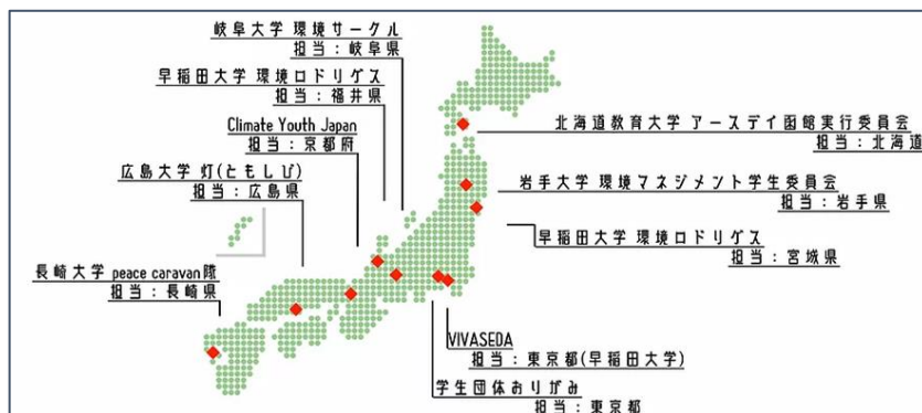
キャンドルナイトリレー イメージ図

これから大人になる若者（学生）がキャンドルナイトに参加することで、地球や環境、社会のことを考えていききっかけを作り、キャンドルナイトのムーブメントを未来へと繋げていきます。