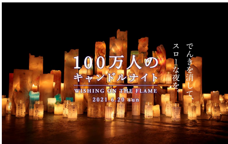
キャンドルナイト イメージ画像

100万人のキャンドルナイト2021サイト： https://candle-night.tokyo/