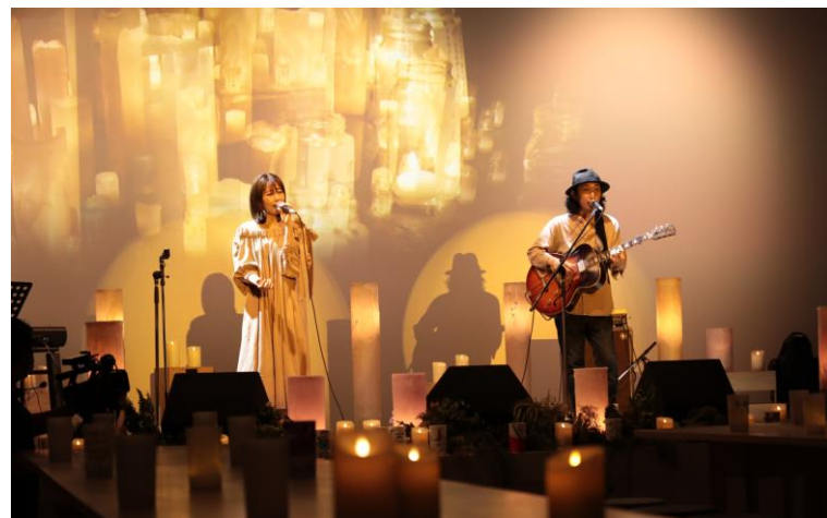
J-WAVEによるアーティストLIVE(昨年の様子)