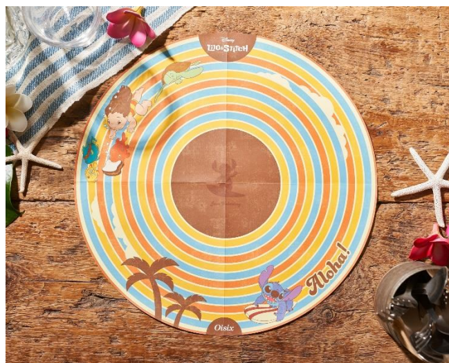
▲ランチョンマット (小物は付属しません)