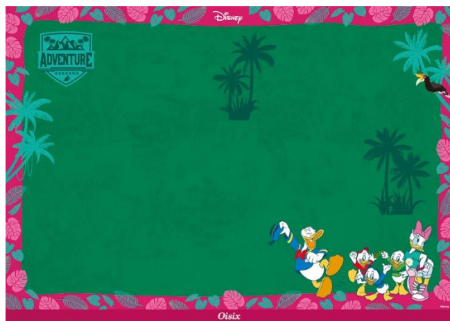
▲ランチョンマット