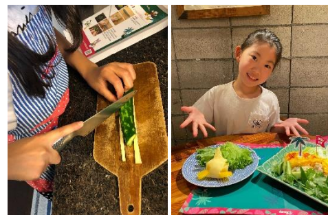
▲お子さまが「ドナルドダックからのサマーチャレンジ」に取り組む様子

当社は、2020年11月よりウォルト・ディズニー・ジャパン株式会社（以下、ウォルト・ディズニー・ジャパン）とのライセンス契約に基づき、子どもたちの“食の未来”を創造し、より良いものにしていくための活動「Table for Tomorrow」（和訳：これからの食卓）プロジェクトを開始しており、本商品はプロジェクト第6弾、第7弾商品です。 https://www.oisix.com/disney/