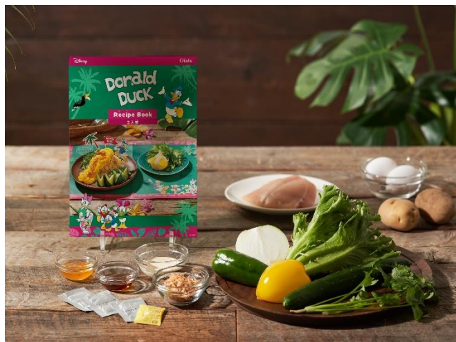
▲レシピブックとお届けする食材