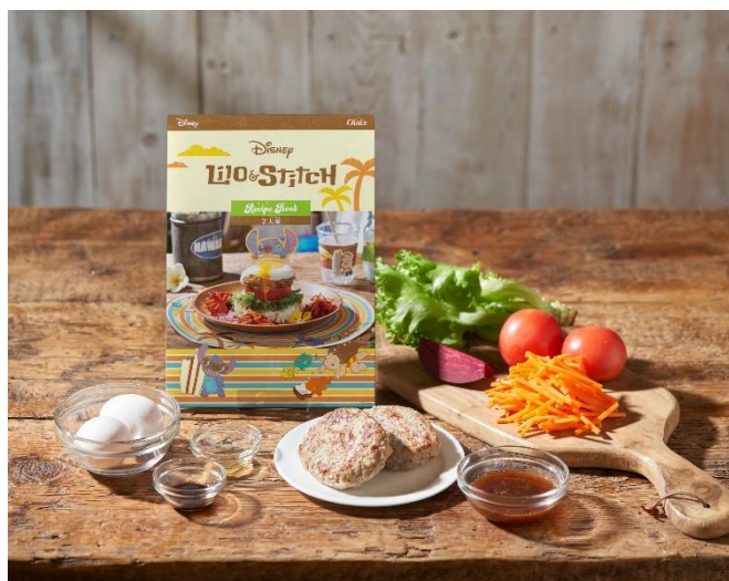
▲レシピブックとお届けする食材