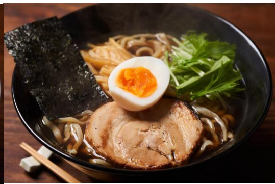
▲柚子醤油らーめん