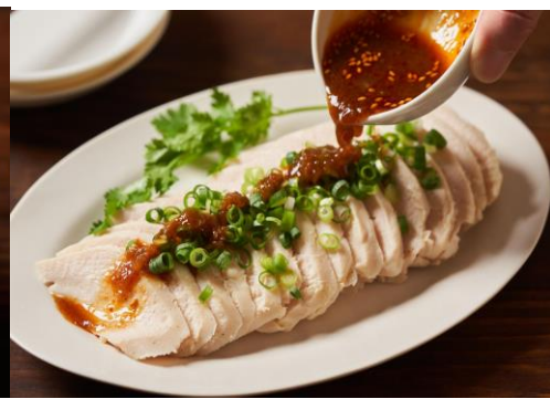
▲鶏チャーシュー& 特製タレセット

販売ページURL： https://www.oisix.com/sc/oisixouchi